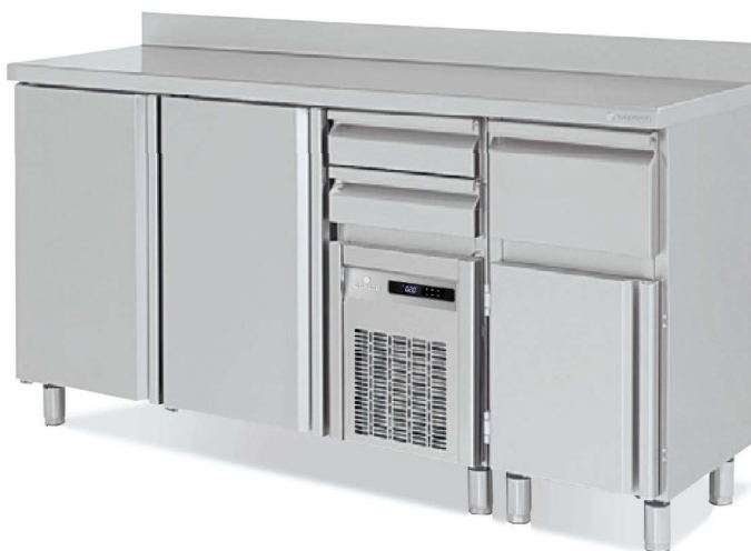
FMR-150 + MCC-50T Encimera especial Special worktop